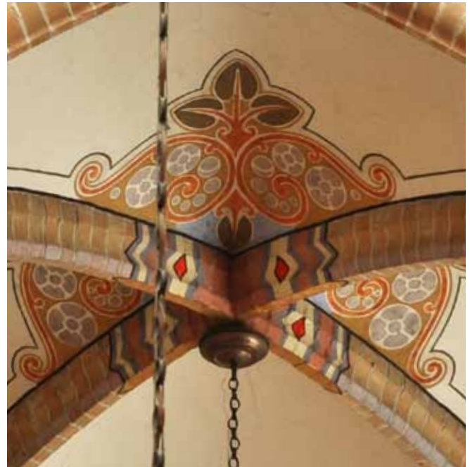
De gewelofschilderingen van de firma Bonekamp te Apeldoorn.

met als resultaat 447.516 gulden. In 1999 werd vervolgens het interieur van de Werenfridus onder handen genomen. Alle muren en gewelven werden stofvrij en schoongemaakt, met name door oudere vrijwilligers. Het karwei kostte 500.000 gulden, inclusief het opnieuw schilderen van muren, gewelven en dergelijke. De kerk voorzag in de helft van dat bedrag. De andere helft werd bijeengebracht door de mensen van Zieuwent, wederom door allerlei acties.