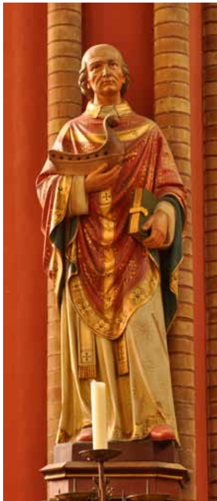
Het beeld van Sint Werenfridus, die herkenbaar is aan zijn bootje. Werenfried was een volgeling van Willibrord. Na zijn overlijden werd hij in een onbestuurd bootje te water gelaten. Op de plaats waar het scheepje aanlegde, werd hij begraven.