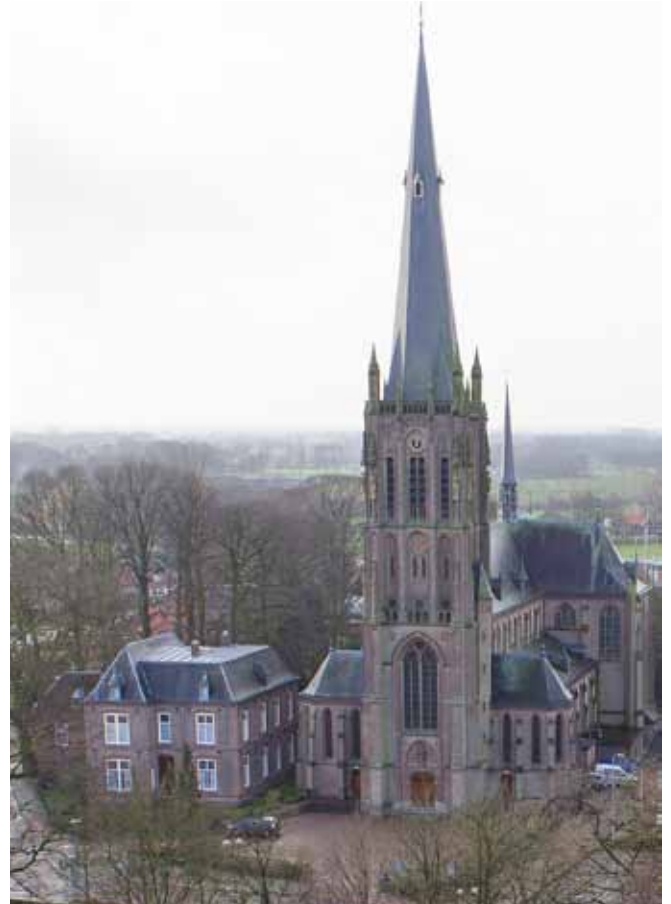
De Werenfriduskerk in Zieuwent uit 1899; naast de kerk staat links de pastorie.

Op 10 oktober 1899 werd de kerk ingewijd door Mgr. Henricus van de Wetering, aartsbisschop van Utrecht. De inrichting van de kerk op dat moment stak schril af bij het huidige beeld, want die bestond vrijwel geheel uit de interieurstukken van de oude kerk. Daarvan is alleen de godslamp nog over. In de loop van slechts enkele tientallen jaren na de inwijding kreeg het gebouw de inrichting zoals die nu nog bijna helemaal te zien is. Bij herhaling werden daarvoor dezelfde ateliers ingeschakeld, met als resultaat een opval-