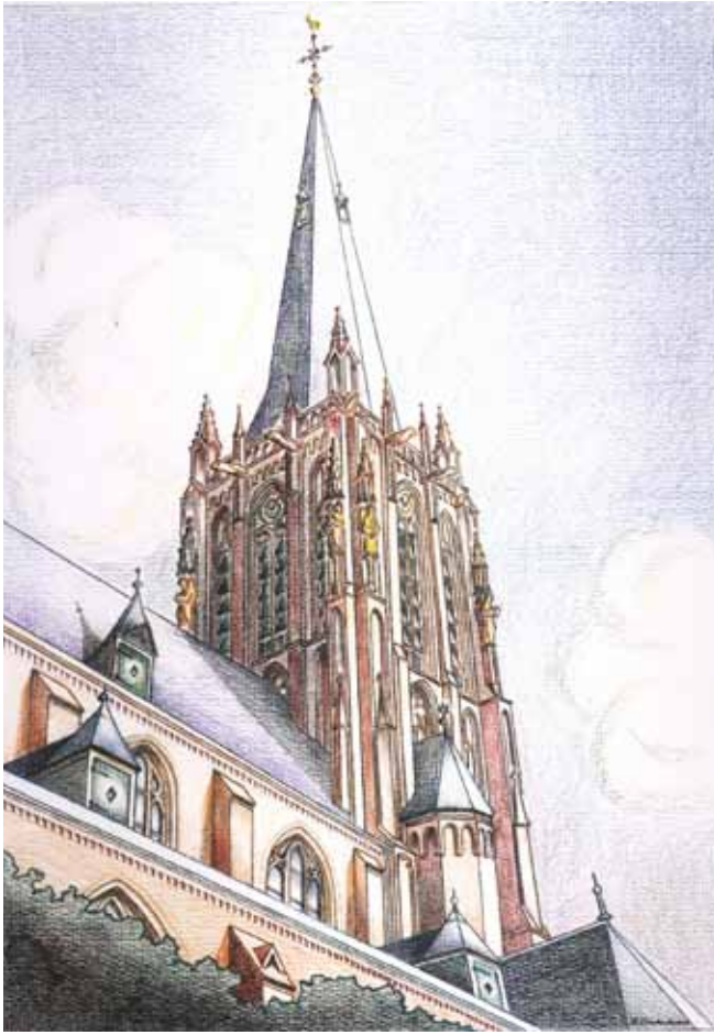
De zuidwestkant van de toren (tekening: Bennie Venderbosch).

verdeeld in drie geledingen die naar boven toe steeds fraaier worden. Vooral in de bovenste geleding heeft Boerbooms alles bijeengebracht wat een gotisch bouwwerk ‘glans’ kan geven: steunberen, pinakels met hogels, vierpassen, beelden van engelen, spuwers in de vorm van dierenfiguren en spitsbogen vormen samen met het verticale lijnenspel in het metselwerk een lust voor het oog, majestueus en sierlijk tegelijk. De vieringtoren met het klokje draagt ook bij aan dit karakter. Ook het schip van de kerk met zijbeuken, kapellen, dwarsschip en het hoogkoor vertoont een perfecte samenhang. Over elk detail is nagedacht.