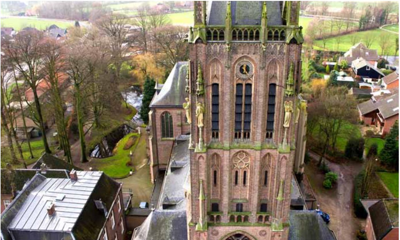
De derde geleding van de toren van dichtbij (foto: Zieuwents Belang/Oudheidkundige Vereniging Zieuwent, 2013).

begroting. Hij schreef dat hij de kerk wel smaller kon maken, maar slechts 2,5 meter korter. Deze verkorting vond Boerbooms door het priesterkoor geen twee traveeën diep te maken, maar slechts één, waardoor er geen plaats was voor zeven maar voor vijf ramen. Hij had veel moeite om deze wijzigingen aan te brengen, want ze hadden invloed op het totaalbeeld van de kerk. De totale bouwsom van kerk en pastorie werd begroot op 127.400 gulden. 4 Bij de aanbesteding in december 1897 in het koffiehuis van A. Toebes te Zieuwent (het latere klooster) werd de bouw van de kerk en de pastorie gegund aan aannemer J. Roodenrijs uit Den Haag voor 130.000 gulden. 5