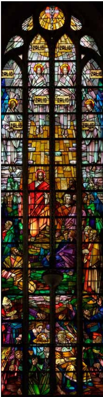
Venster met de acht zaligsprekingen in het bovenste deel en in het benedendeel onder andere de onthoofding van Johannes de Doper (foto: Karel Beerten, 2011).