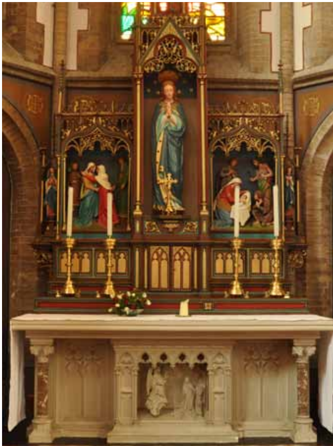
Het Maria-altaar, vervaardigd door de firma Besseling (foto: Karel Beerten, 2011).