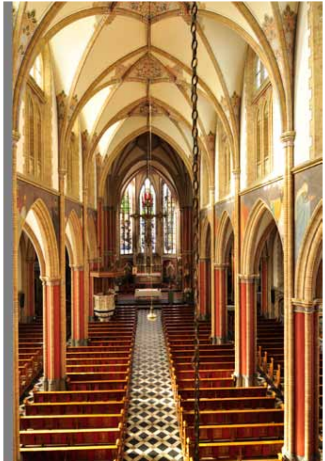
Het schip van de kerk, gezien naar het priesterkoor (foto: Karel Beerten, 2012).

In het priesterkoor bevinden zich vijf gebrandschilderde vensters. De oorspronkelijke drie ramen achter het hoofdaltaar raakten in verval en werden in 1959 vervangen door nieuwe ramen van glazenier Schifferstein in De Bilt. Het middelste raam toont voorstellingen uit het leven van Christus. Links en rechts daarvan worden de vier oudste geloofsverkondigers van de Nederlandse kerkprovincie afgebeeld: Ludger, Werenfridus, Willibrordus en Bonifatius. In 1930 schonk de parochie de gebrandschilderde ramen boven het Maria-altaar met De opdracht van Maria in de tempel, Maria bij het lege graf en De visitatie (ontmoeting van Maria en Elisabeth). Het grote transeptraam links van het Maria-altaar heeft als hoofdthema De bergrede van Christus. Het hoofdthema van het grote raam aan de andere kant van het transept is Mozes die de tafelen der wet heeft ontvangen op de berg Sinai. Al deze ramen kwamen uit het atelier van glazenier Kocken te Utrecht. In de zijbeuk aan de zijde van het Jozefaltaar bevindt zich een raam met een afbeelding van de heilige Isidorus. Het is geplaatst in 1960 en vervaardigd door Henri Schifferstein. De overige negen ramen, vijf in de zijbeuk aan de kant van