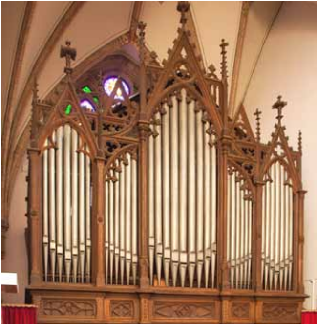
Het orgel van de firma Eggert heeft een neogotisch front.

weer naar beneden gehaald. Pas in 1948 verzocht pastoor Bergervoet in een brief aan de bisschop om tot aanschaf van nieuwe klokken over te gaan. 8 Het bestuur ontving van het Rijk als schadevergoeding voor de oude klokken, die een totaalgewicht van plus minus 5000 kg hadden, 11.250 gulden à 2,25 gulden per kilo. Uit eigen middelen moest het bestuur nog 22.250 gulden bijleggen.