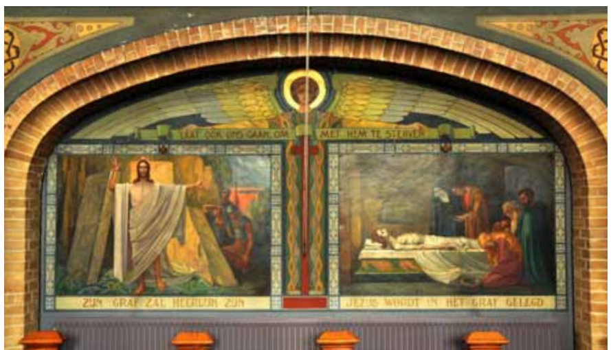
De laatste twee van de zestien kruiswegstaties.