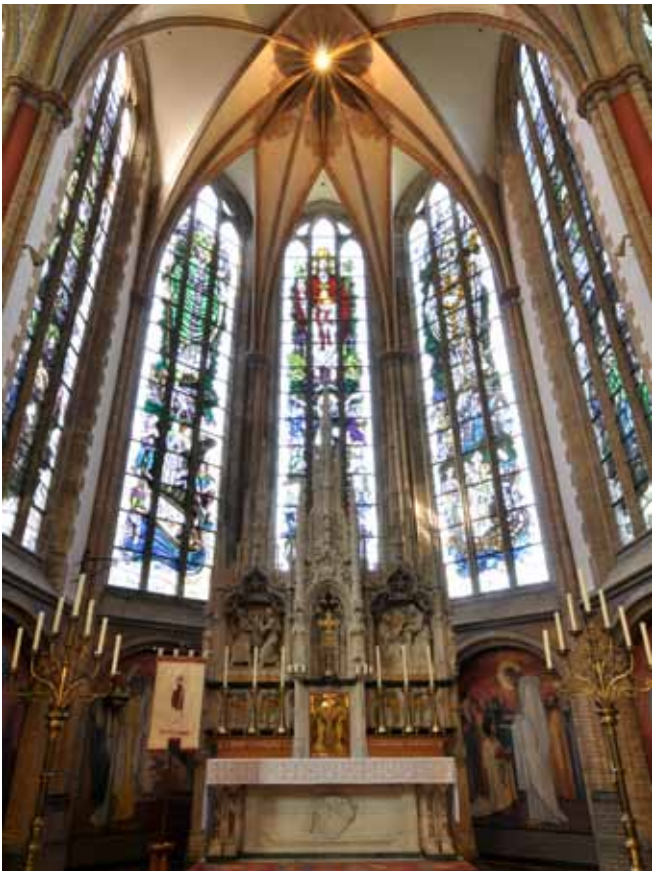
Het hoofdaltaar (vervaardigd door de firma Besseling) in het koor met een retabel van de firma Mengelberg en de vijf nieuwe ramen uit 1959.